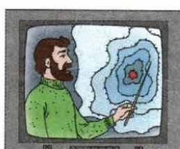
6) Brian Woodriff, an oceanographer