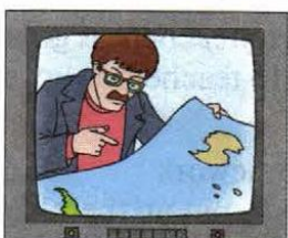
4) Alan Macmillan, a seismographer